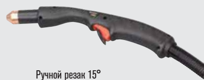
Ручной резак 15°