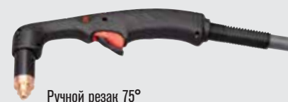
Ручной резак 75°

(дополнительные варианты резаков см. на веб-сайте www.hypertherm.com )